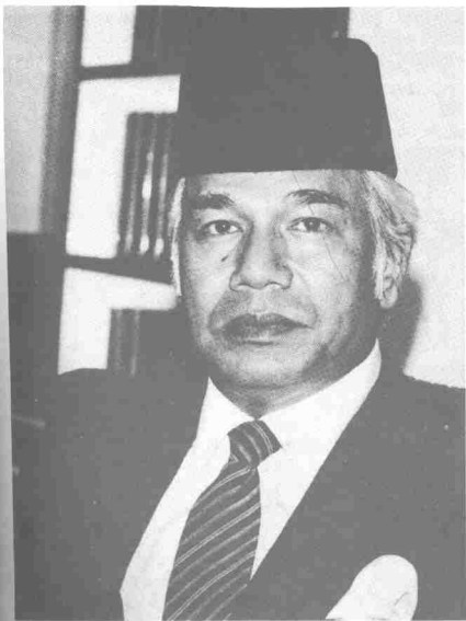
Sultan Azlan Shah, Sultan Perak ke-34