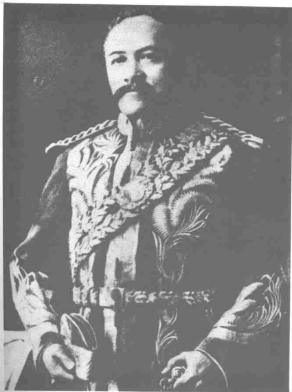
Sultan Abdullah Muhammad Shah II, Sultan Perak ke-26