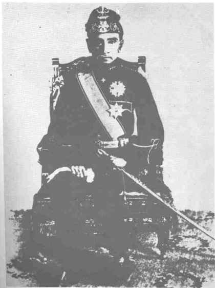
Sultan Idris, Sultan Perak ke-28