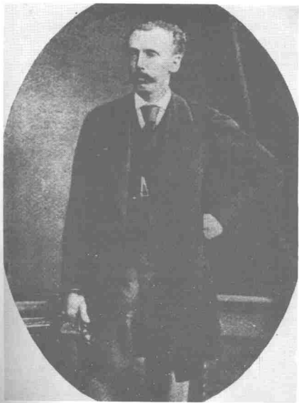
J.W.W. Birch, Residen Perak I