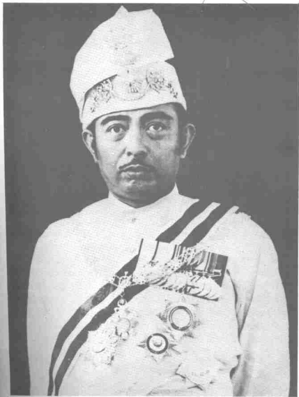
Sultan Idris, Sultan Perak ke-33